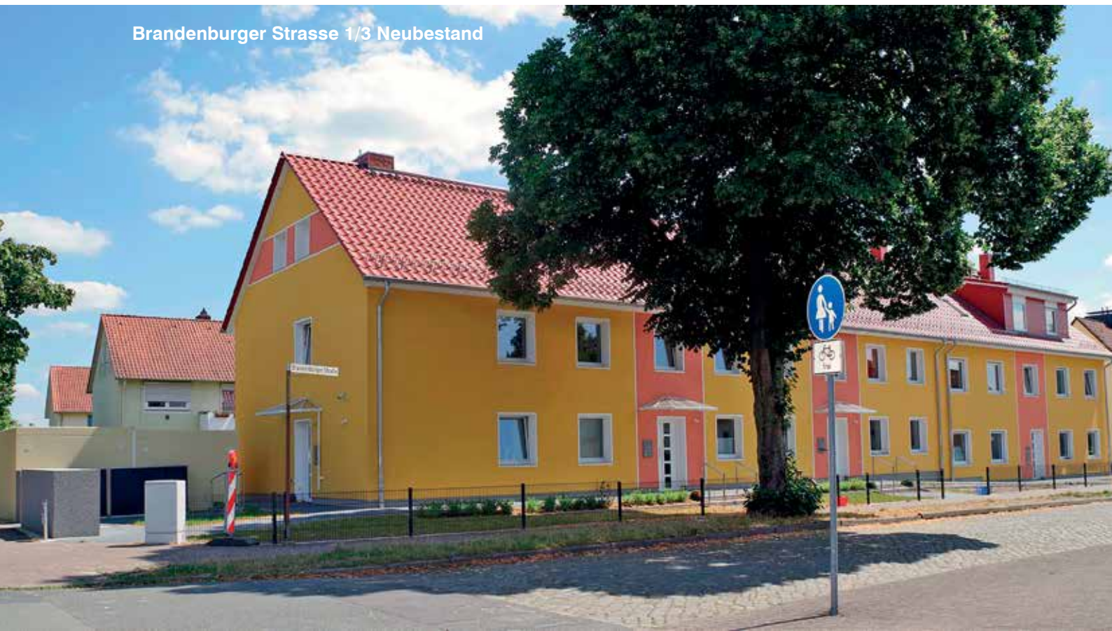
Brandenburger Strasse 1/3 Neubestand

Neben der energetischen Modernisierung wollen wir zur vollständigen barrierefreien Erschließung die beiden Treppenhäuser durch Aufzüge ersetzen und die Treppenhäuser vor dem Gebäude neu errichten. Diese hochwertige und kostenintensive Maßnahme ermöglicht nach Fertigstellung, die vollständige barrierefreie Erreichbarkeit für die Nutzungsberechtigten vom Keller bis zum Dachboden. Die wesentlichen Arbeiten werden allerdings erst ab dem Frühjahr 2019 erfolgen.